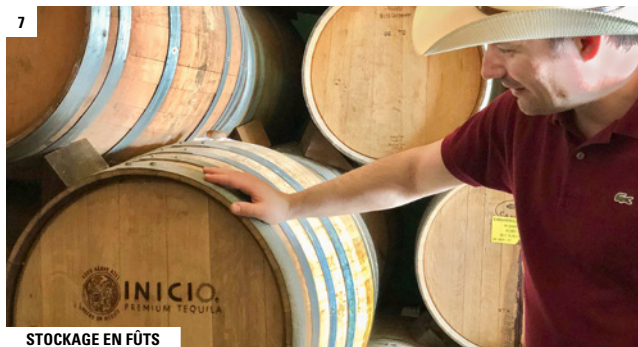
STOCKAGE EN FÛTS