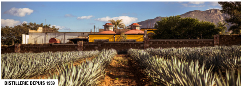
DISTILLERIE DEPUIS 1959